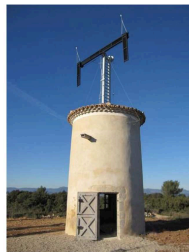
Tour Chappe de Saint-Bauzille-de-la-Sylve