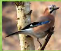
Geai des chênes